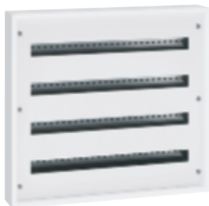
3 372 14

coffrets de distribution métal « prêts à l'emploi »