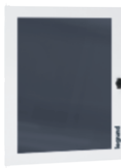
3 372 74