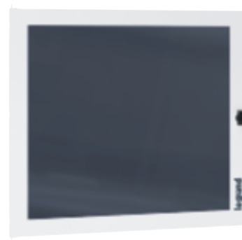
3 372 84