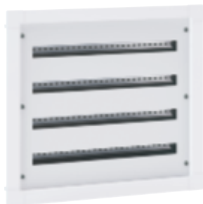
3 372 34