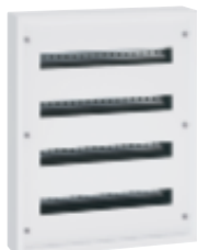
3 372 04

coffrets de distribution métal « prêts à l'emploi »