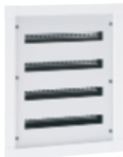
3 372 24