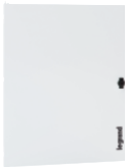
3 372 54