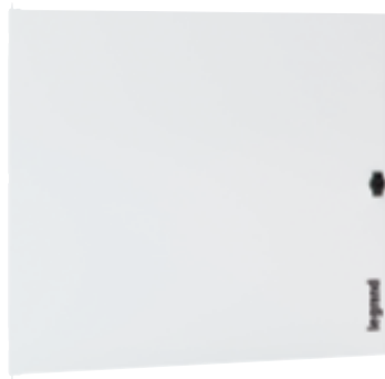
3 372 64